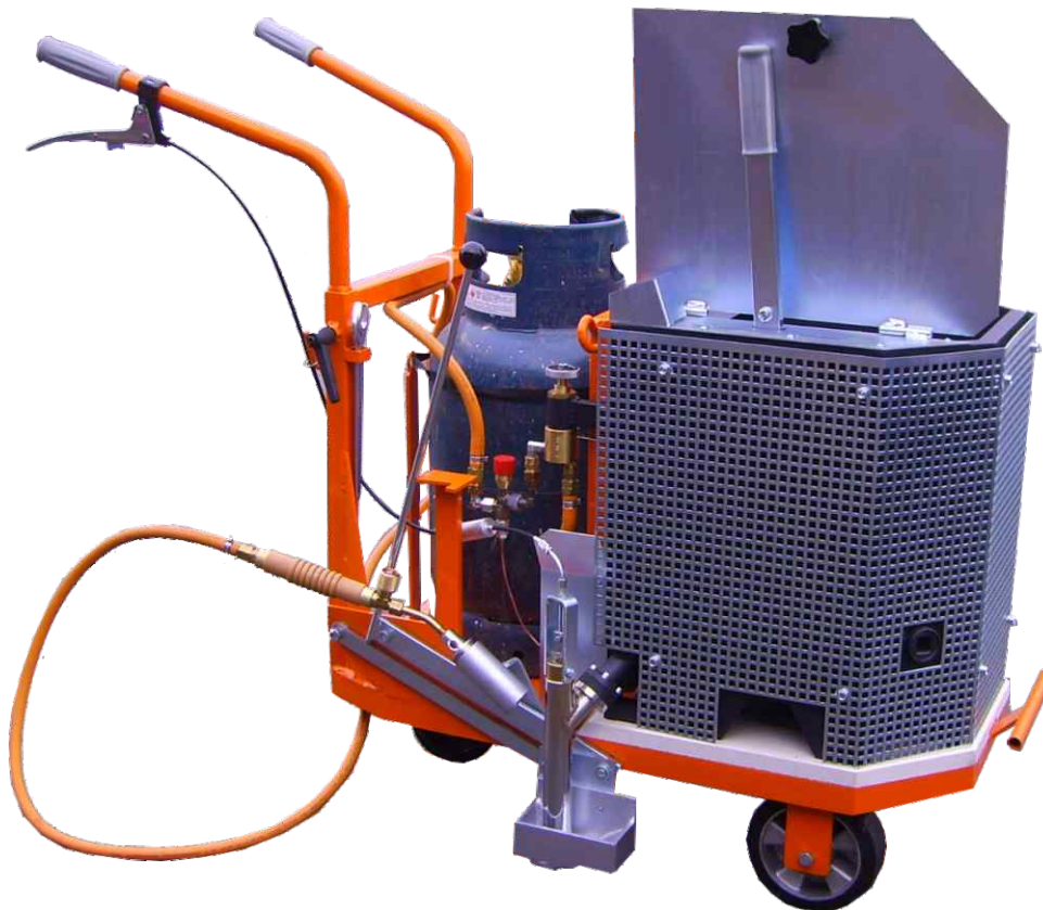
DICOREL 3001 B

objem ohřívací nádoby: 40litrů - způsob ohřevu: nepřímý - váha: 98kg palivo ohřevu: PROPAN-BUTAN - tepelný regulátor: dle nastavených hodnot