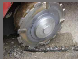
detail frézy a spáry