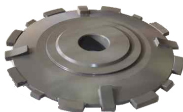
Fréza na divoké spáry