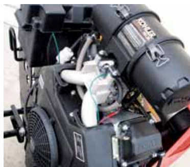
motorová jednotka KOHLER