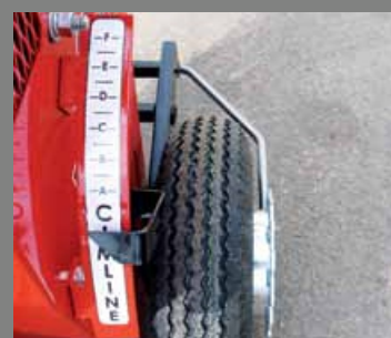
ukazatel hloubky frézování