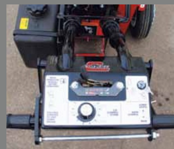
detail ovládání stroje