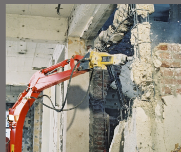
Ukázka práce s SB 52