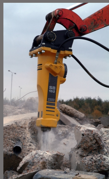
Ukázka práce s SB 152