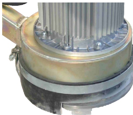
Detail uložení brusného talíře