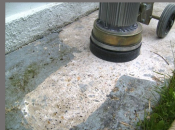
Ukázka práce s ALPHA