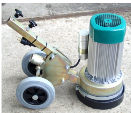
Ukázka práce s Contec ALPHA

Doporučujeme použití s vysavačem SOL 2000 nebo CFM 125