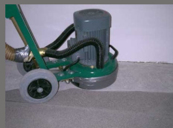
Ukázka práce s ALPHA